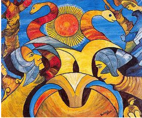
Balázs János: A Nap szerelmesei

A kiválasztott képet keresd meg az interneten a festő neve alapján, így lehetőség van kinyomtatni A/4-es méretben. Ha otthon nincs erre módod, segítünk az iskolában.