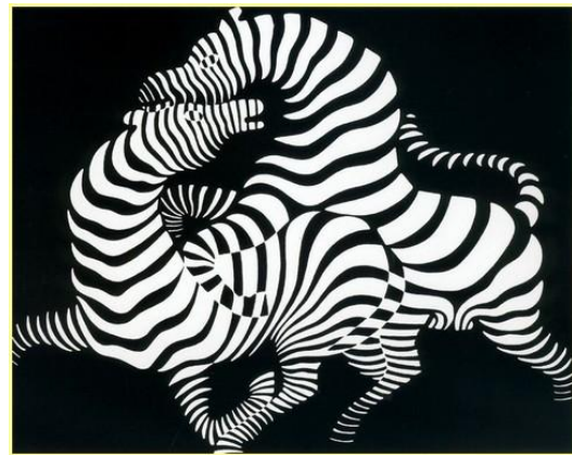
Victor Vasarely: Zebrák