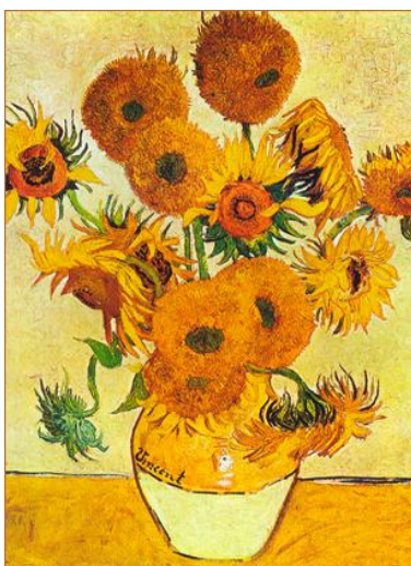
Vincent Van Gogh: Váza napraforgókkal