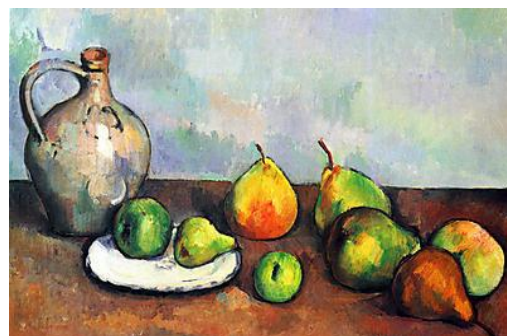
Paul Cezanne: Csendélet korsóval és gyümölcsökkel

Értékelési szempont: a művészi összhatás!