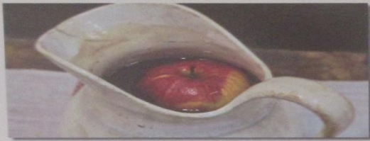
Karácsonyi alma a vizeskancsóban 2013

У исхрани је магичну функцију за обезбеђење доброг здравља код католичких Мађара имала божићна јабучка, а код православних Срба божићни колач – чесница. Заштитно својство су води за умивање давали Божићна јабучка или босиљак који се налазио у води од Буржевана, односно ако су приликом умивања бивали утрљавани у лице укућани (RADULOVAČKI 2003, – стр. 105). Још у оно време (током седамдестих година XX века, тамо где је био копани бунар) на Бадињак је убацивана једна црвена јабучка у бунар, а и приликом умивања је стављана у лавор јабучка. (НАВ АБОЊИ, 1999, – стр. 332) Код Мађара католика постоји обичај стављења јабучке у бокал, канту и лавор. У војвођанским етнографским студијама о обичајима и веровањима око Божићних празника има података и о присуству јабучке на трпези зарад осигурања здравља.