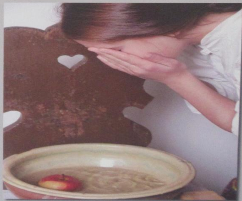
A leány almáról mosakodik 2013

Девојка се мије са јабучке 2013.