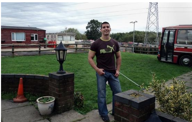
Gabi először Jersey-ben próbált szerencsét

2009-ben még nem ment volna ilyen flottul. Augusztus 20-án ült kocsijába Budapesten és Jersey-ig meg sem állt. Nem tudott angolul, nem volt végzettsége sem, itthon albérletet és autóhitelt fizetett a havi 100-150 ezer forintos fizetéséből. Volt kamionsofőr, dolgozott kaszinóban, gyógyfürdőben, diszkóban. Aztán egy szép napon elege lett: „Eldurrant az agyam, elég rossz állapotban voltam, és elindultam...”