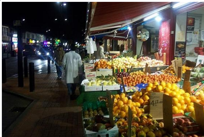
Bury Park by night