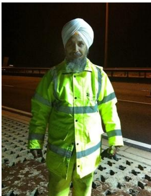
Kolléga a lutoni autópálya-építésről