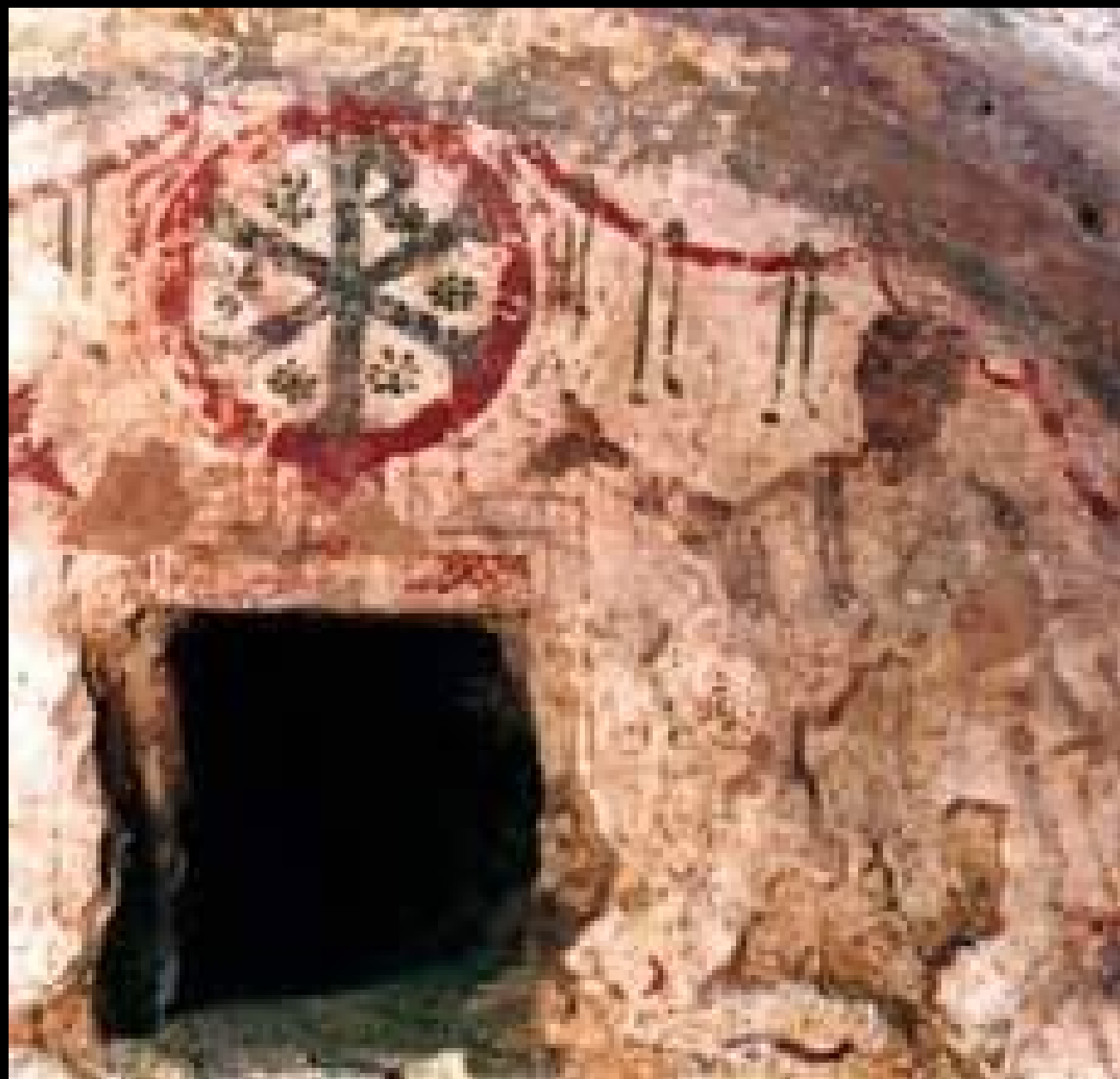
6. Pécsi ókeresztény sírkamrák