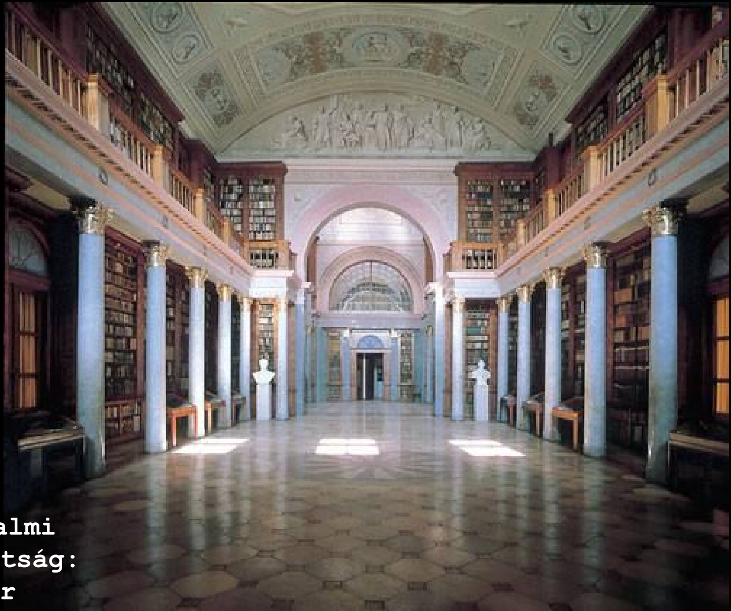
5. Pannonhalmi Bencés Főapátság: könyvtár