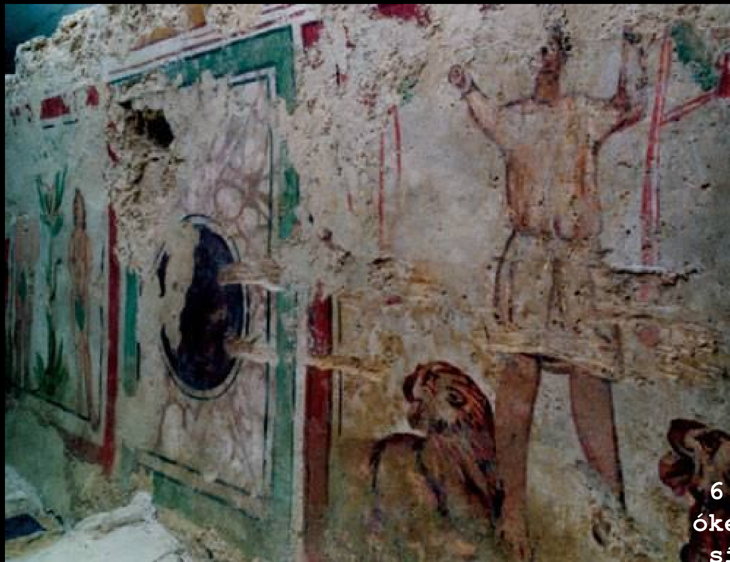
6. Pécsi őkeresztény sírkamrák