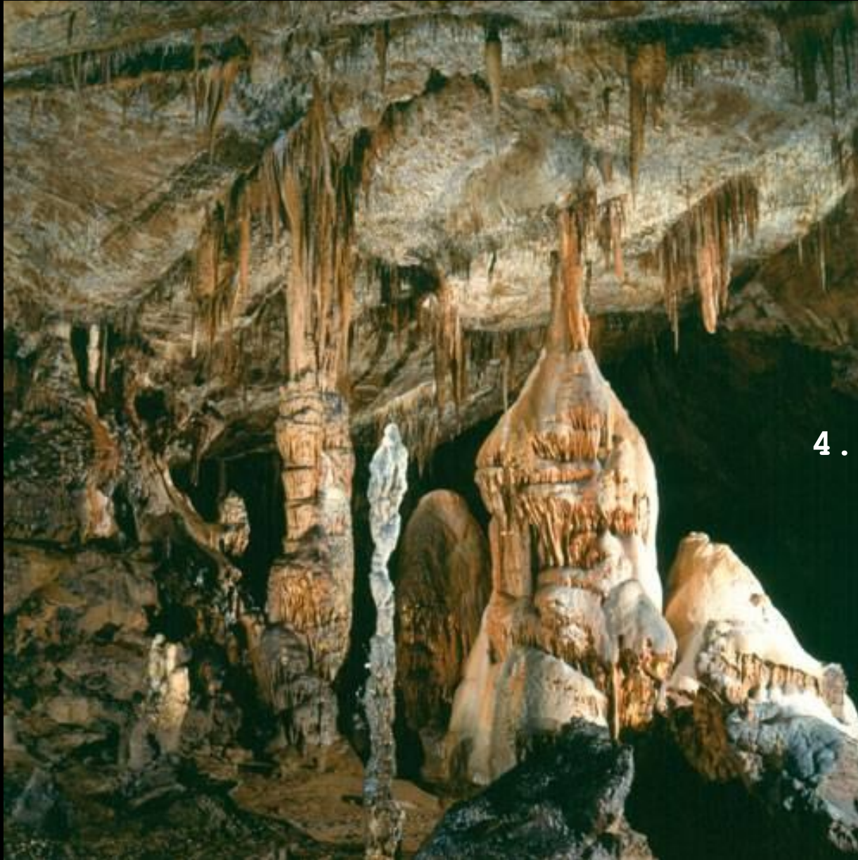
4. Aggteleki-karszt: Baradla