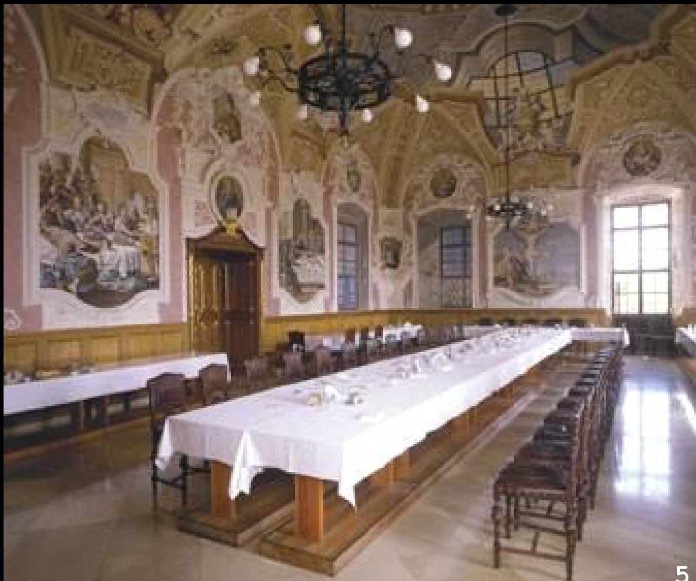
5. Pannonhalmi Bencés Főapátság: ebédlő