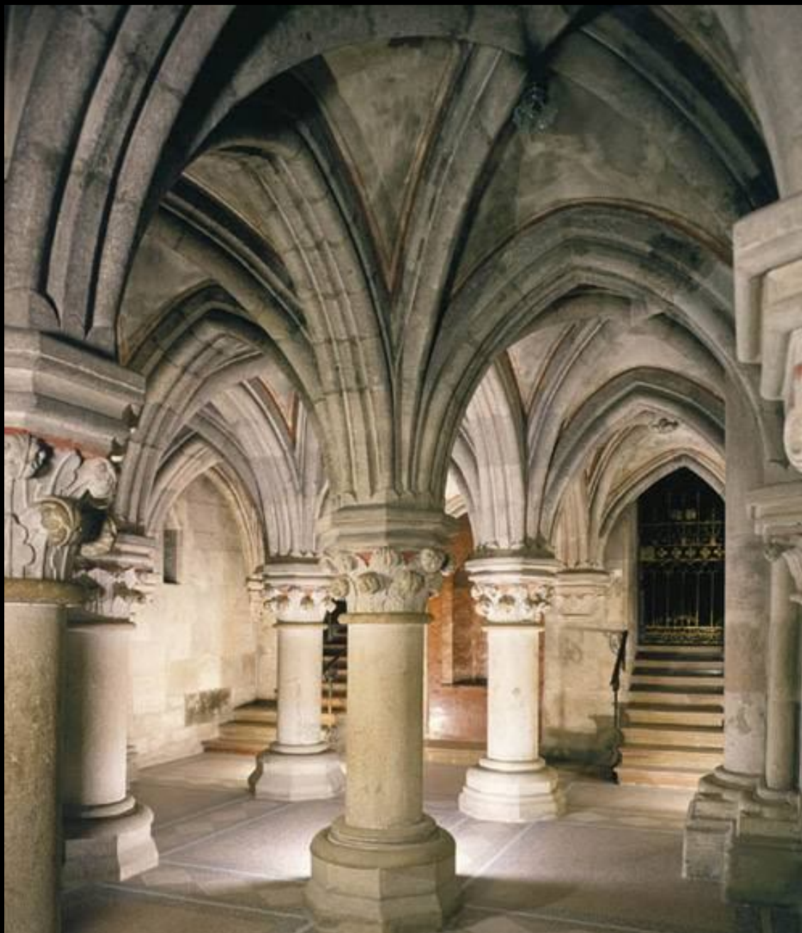
4. Pannonhalmi Bencés Főapátság: altemplom