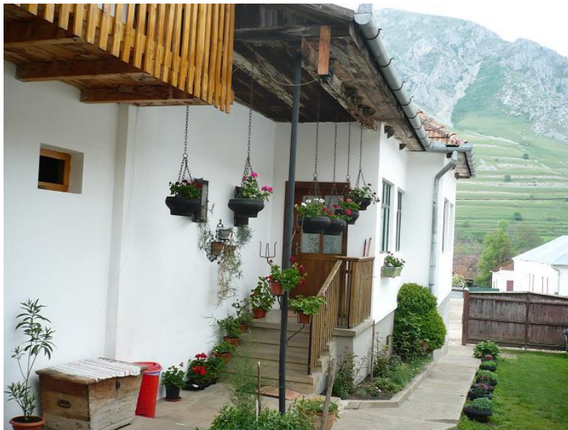
A házunk, háttérben Székelykövel

Reggel fél 8-kor indultunk el a Petőfi tanya elől, Újpestről. Hosszú, fárasztó utunk jól telt, sokat neveltünk, beszélgettünk. Többször megálltunk benzinkutaknál pihenő gyanánt. A határig viszonylag hamar elértünk, és nem volt semmi gond a határnál. Utunk első igazi állomása Nagyvárad volt. A püspöki palotát kívülről néztük meg, míg a Nagyboldogasszonynak szentelt templomot belülről. Az idegenvezető mesélt a nagyváradi életről, történelemről. Ezek után Körösfőn , Kalotaszentkirályon és a Királyhágón álltunk meg. Körösfőn megkoszorúztuk Vasvári Pál szobrát, majd vásároltunk a kirakodóvásárban. Este 7-8 között megérkeztünk Torockóra ! Beköltöztünk a szállásra. Mi rögtön a ház elejében voltunk, ahonnan szép kilátás nyílt a felettünk magasodó hegyvonulatra. A szoba öt ágyas volt, én Dorkával, Dorottyával, Fruzsival és Renivel voltam együtt. A berendezkedés után vacsoráztunk, ami viccesen telt, sok céssel beszélgettünk, és neveltünk velük, pedig idáig nem voltunk velük jóban. Takarodó 11 óra körül volt, hamar elaludtunk a hosszú út fáradtsága miatt.