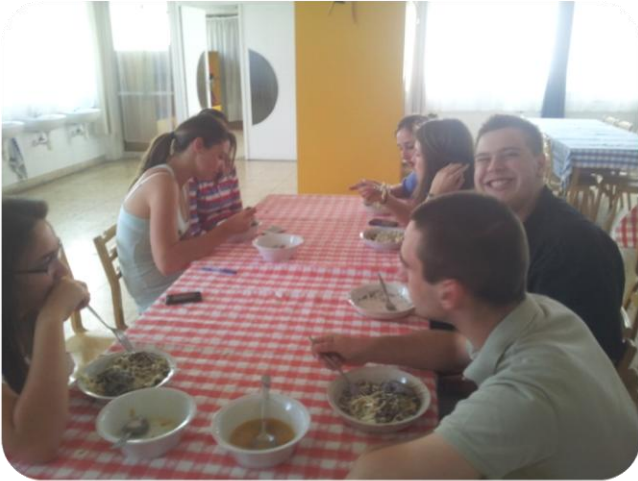
Közösen még a Junioros kaja is ehető...