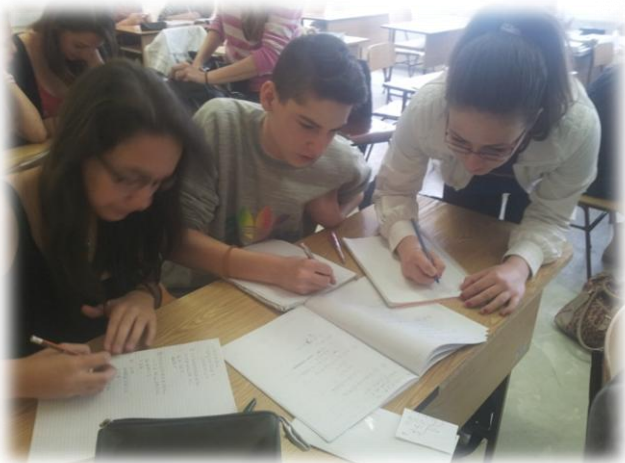
Mindenkinek kész a leckéje?