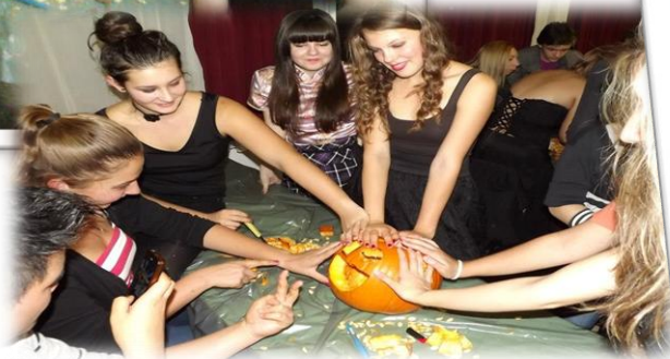
A szürke hétköznapokon is feldobjuk egymást.

Az osztályunk minden iskolai programon is részt vesz.