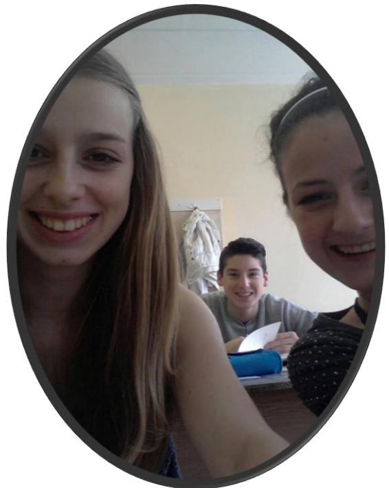
Készen állunk a 9. órára!!!