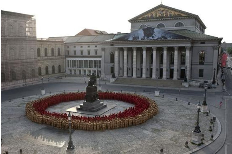
I. Miksa emlékműve (Max-Joseph-Monument) a belvárosban