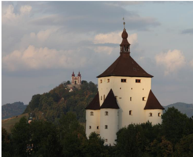
Óvár, Szent Katalin templom