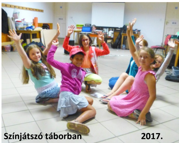
Színjátósó táborban 2017.

(A „Károlyi Gimnázium Archív” feliratú címkére kattintva iskolánk régi kincseire bukkanhatnak.)