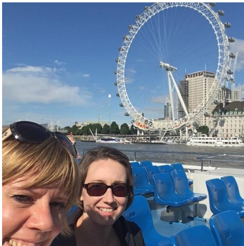
A HOMERTON COLLEGE