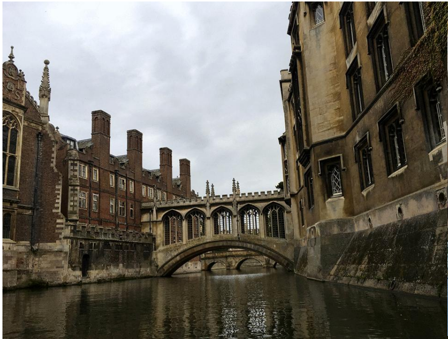
HAJÓKÁZÁS A CAM FOLYÓN