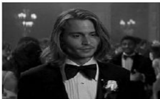
George Jung (Jhonny Depp)